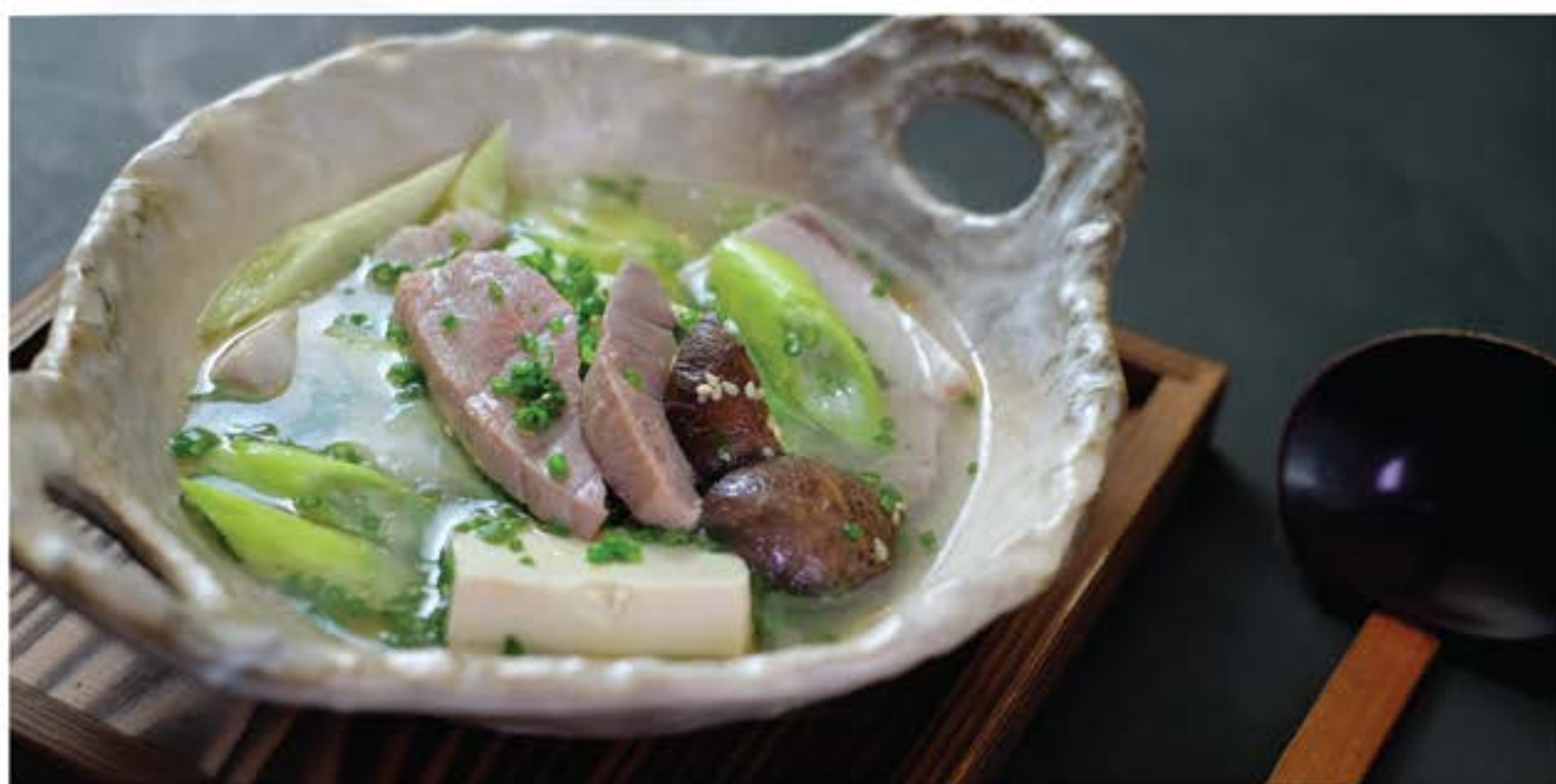
鮪のねぎまスープ Maguro no Negima Soup tuna and Welsh onion soup