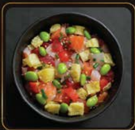
Mini Bara Chirashi