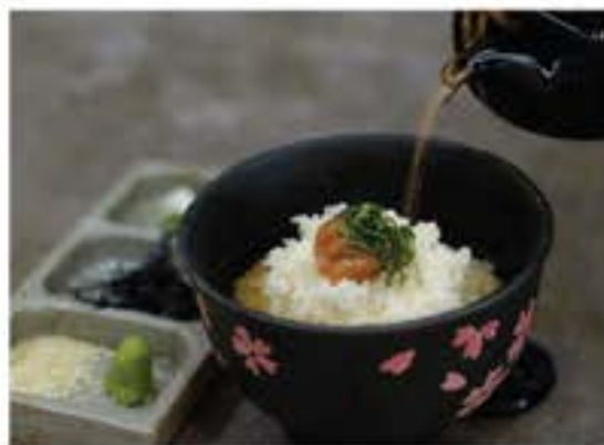
梅茶漬 Ume Chazuke plum and rice with tea broth 55