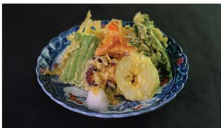
野菜天婦羅盛り合わせ Yasai Tempura Moriawase 90 assorted vegetables tempura