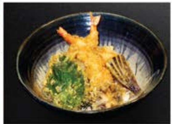
天井 Ten Don bowl of rice topped with tempura 175