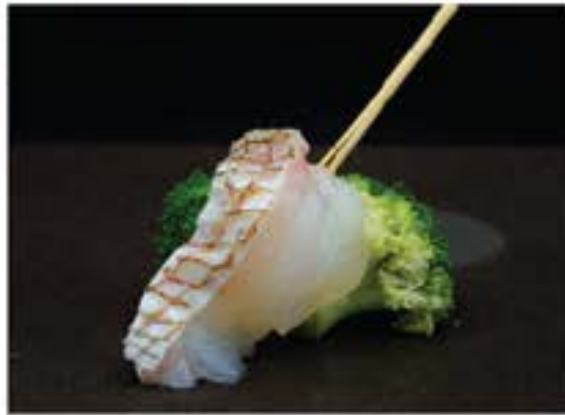
Sakana • 魚 30