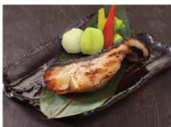
銀だら焼き <塩・照り焼き> Gindara Yaki

grilled silver cod with salt /teriyaki sauce