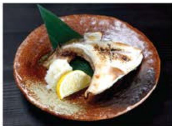
はまちカマ炭火焼 Hamachi Kama Sumibiyaki