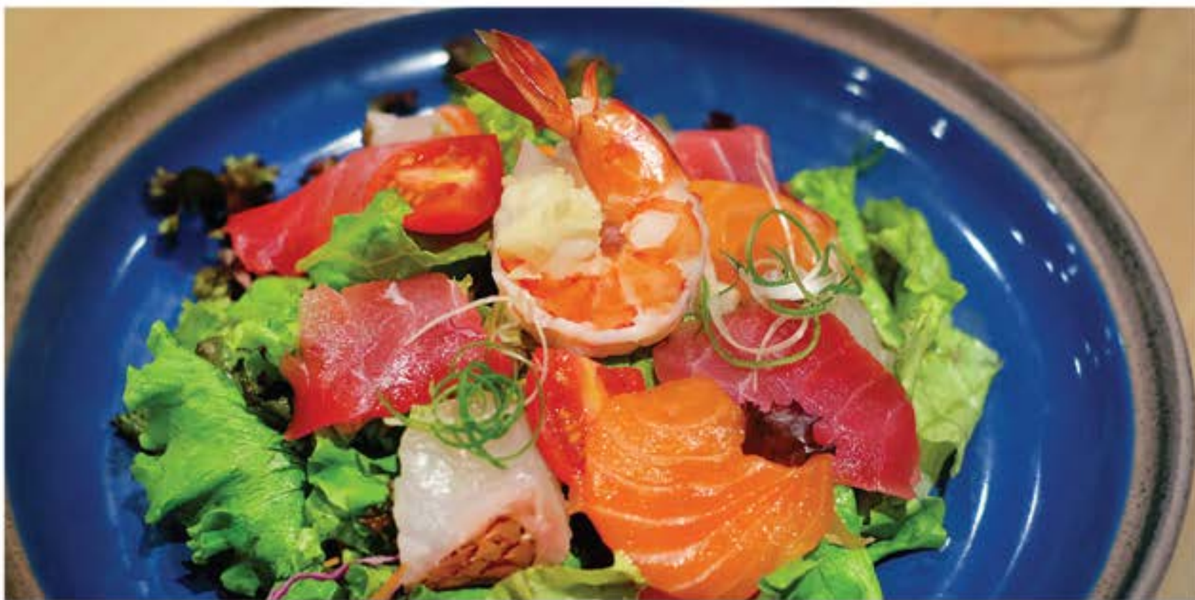
海鮮シーザーサラダ Kaisen Caesar Salad