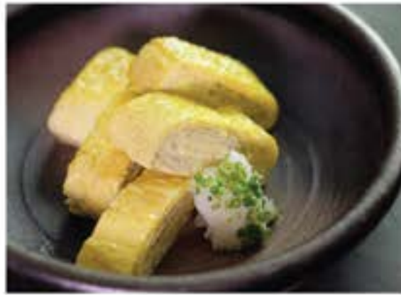
出汁巻き玉子 Dashimaki Tamago 85 Japanese rolled omelette