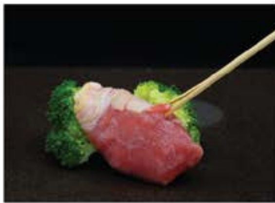
Gyurose • 牛ロース 35