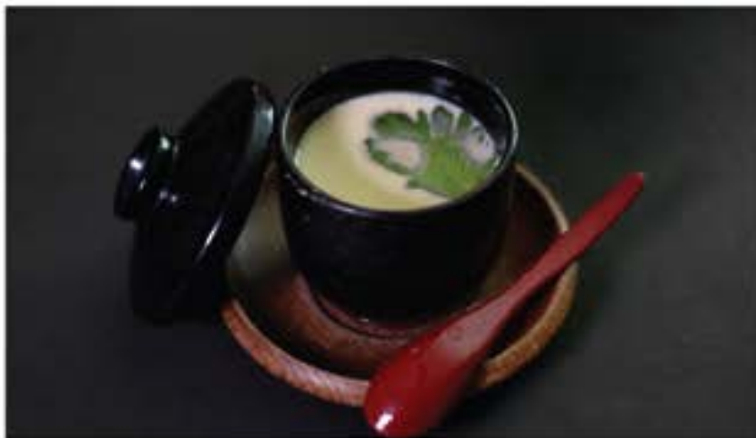
茶碗蒸し 45 Chawan Mushi