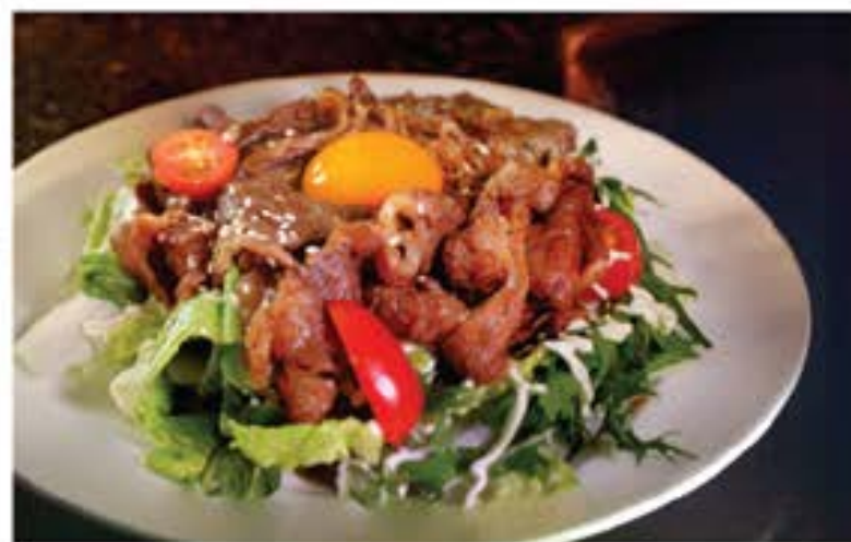
すき焼きサラダ Sukiyaki Salad