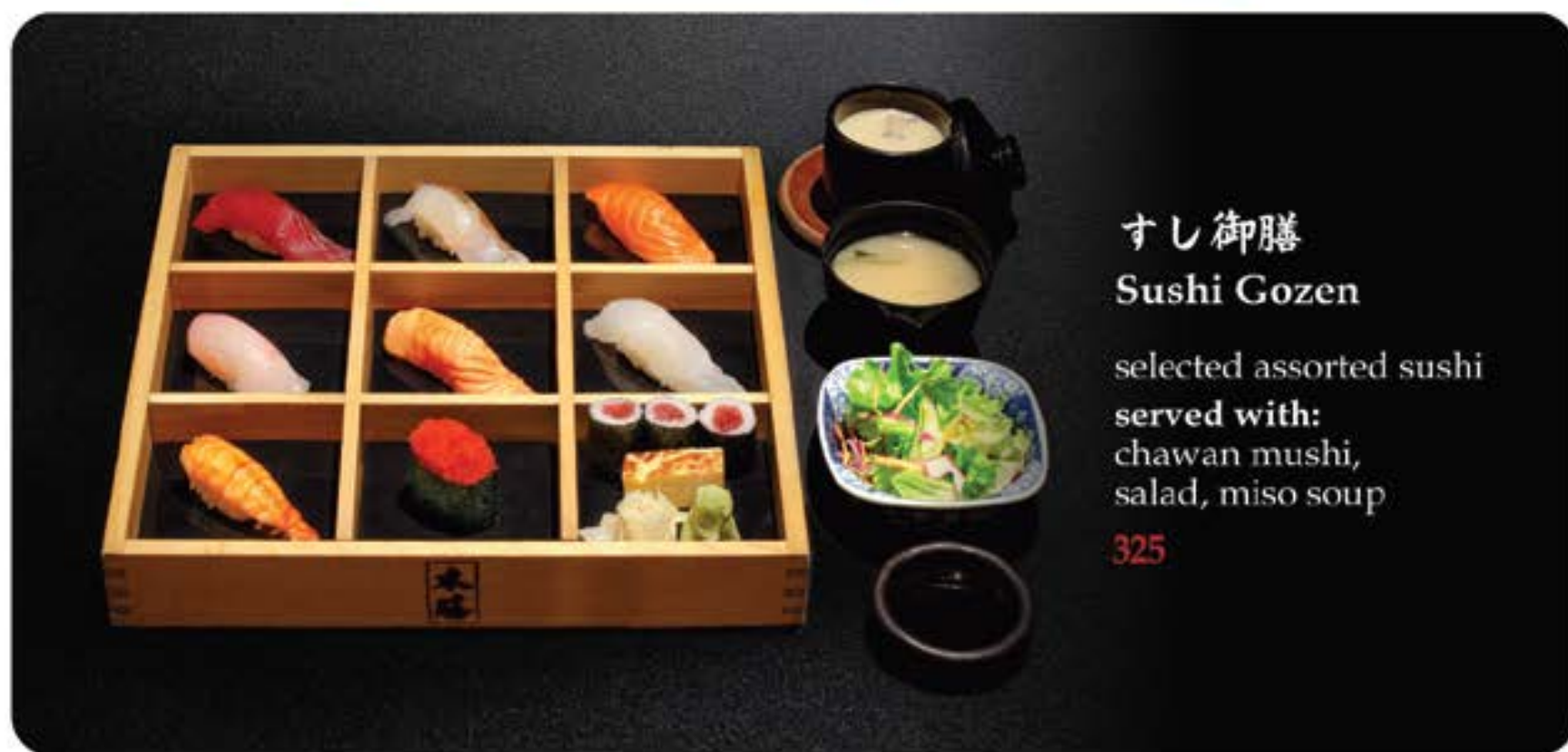
すし御膳 Sushi Gozen

*Menu will be made based on ingredients' availability