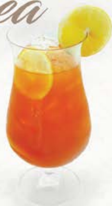
レモンティー Lemon Tea