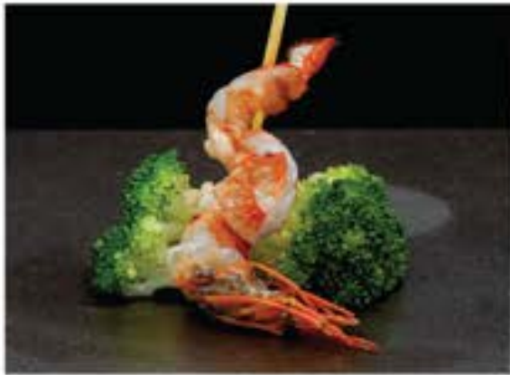
Ebi • 海老 30