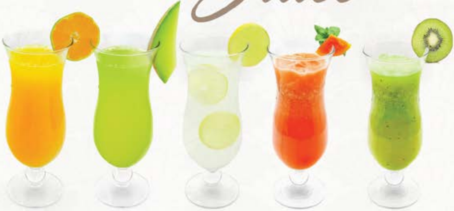
オレンジ Orange Juice 65