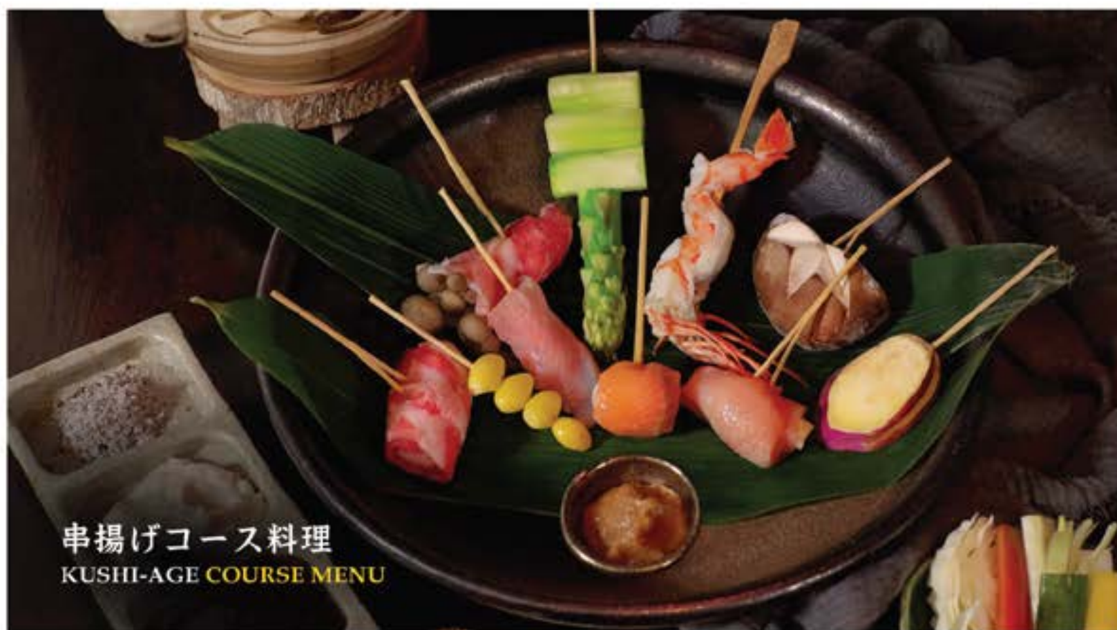
串揚げコース料理 KUSHI-AGE COURSE MENU