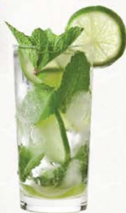
Virgin Mojito バージンモヒート 90