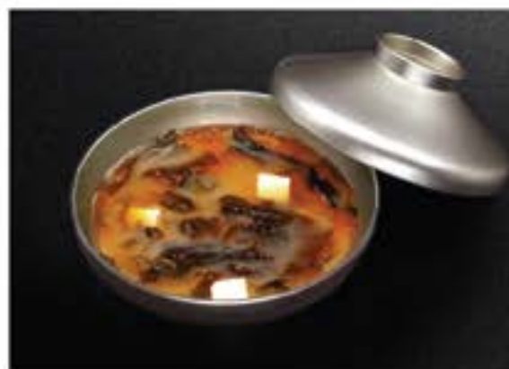
赤出汁 Akadashi 55 Akadashi soybean soup