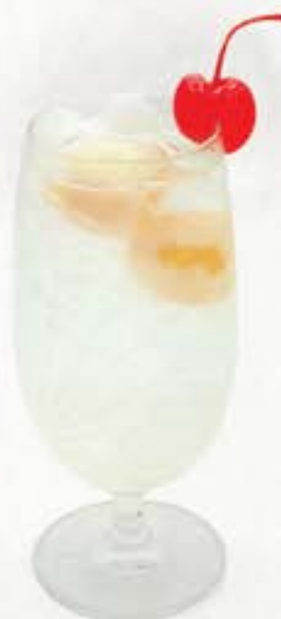
Lychee Squash レイシスカッシュ 65