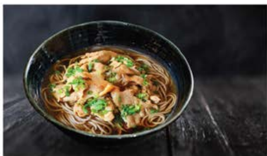
牛肉 そば/うどん Gyuniku Soba / udon 130 beef soba or udon