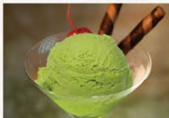
Matcha Ice Cream 抹茶アイスクリーム 60