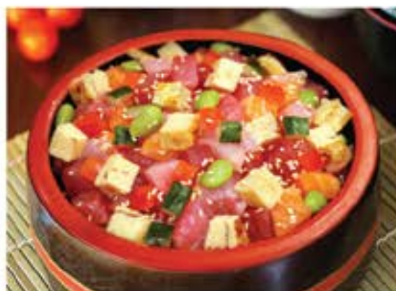
バラちらし Bara Chirashi 305

bowl of rice topped with tuna, salmon and avocado