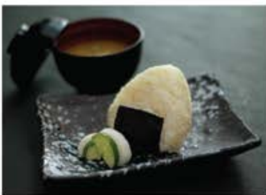
おにぎり 味噌汁付き Onigiri include miso soup