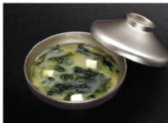
味噌汁 Miso Soup 35