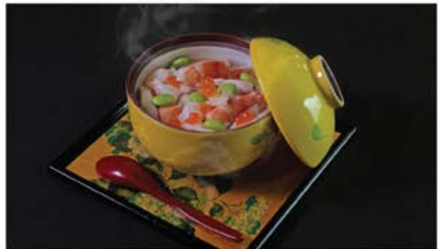
海鮮茶碗蒸し 100 Kaisen Chawan Mushi seafood chawan mushi