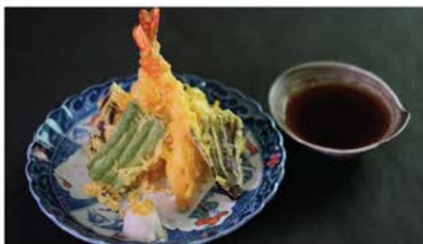
天婦羅盛り合わせ Tempura Moriawase 135 assorted tempura