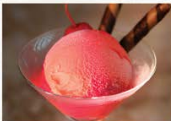
Raspberry Sorbet ラズベリーソルベ 60