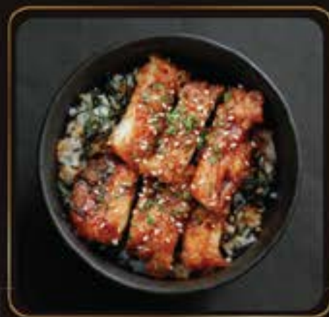
Mini Teriyaki Don