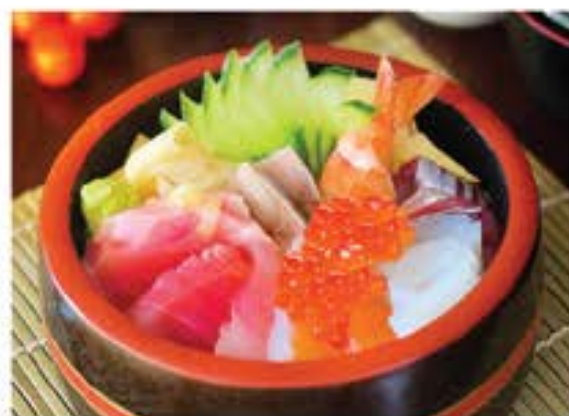
海鮮丼 Kaisei Don 400

*Menu will be made based on ingredients' availability