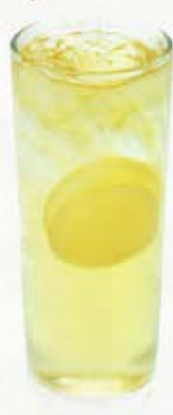
Highball ハイボール 130