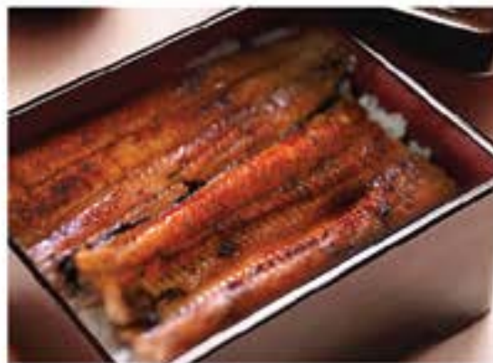
うな重 Una Jyu premium grilled tender eel on top of rice 390