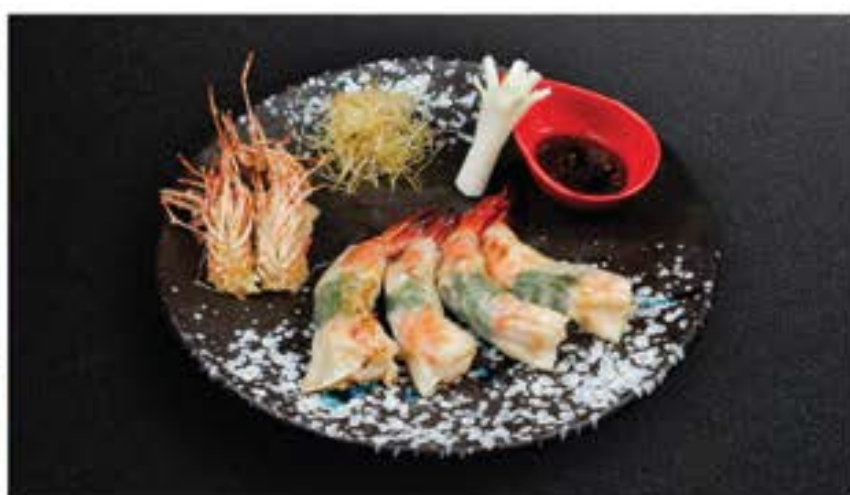
海老餃子 Ebi Gyoza 190 pan-fried dumpling filled with shrimp served with dipping sauce