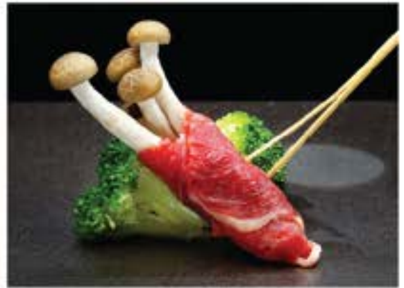
Gyu Kinoko • 牛きのこ 32