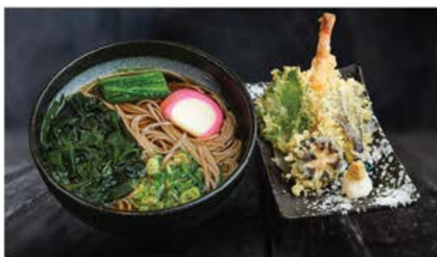
天婦羅 そば/うどん Tempura soba / udon 120 assorted tempura soba or udon