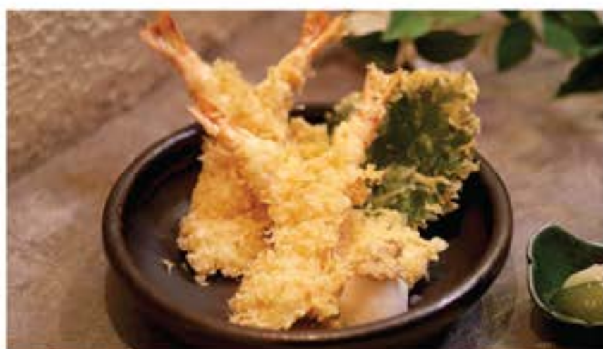
海老天婦羅 Ebi Tempura 175 king prawn tempura