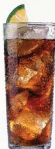
Coke Highball コークハイ 125