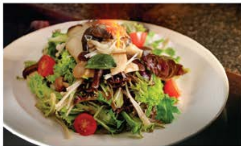
キノコサラダ Kinoko Salad