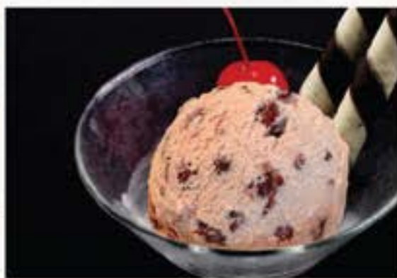
Ogura Ice Cream 小倉アイスクリーム 55