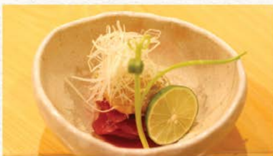
マグロ酢味噌がけ