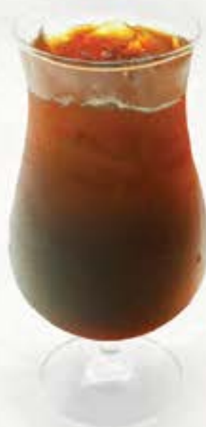
ウーロンティー Oolong Tea