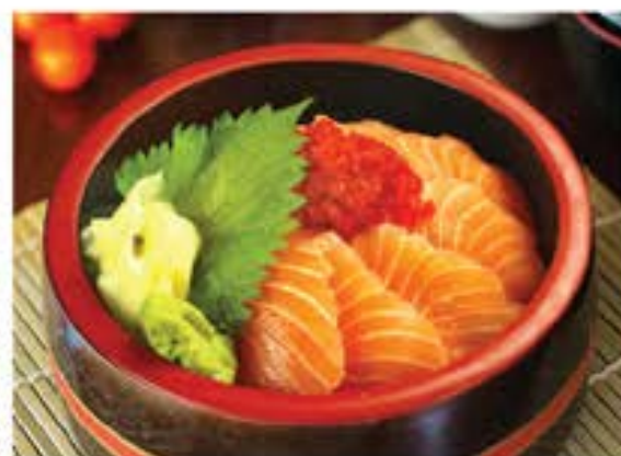
サーモンちらし Salmon Chirashi 370

bowl of rice topped with tuna, salmon and avocado