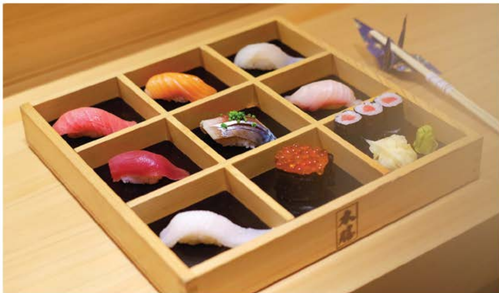
おまかせ握り Omakase Nigiri