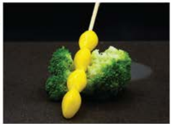
Ginnan • 銀杏 25