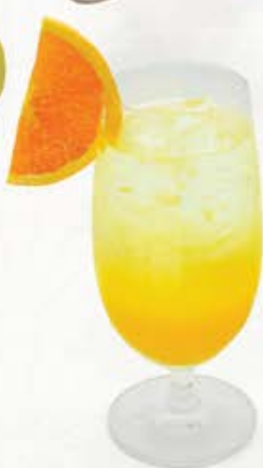
Orange Squash オレンジスカッシュ 65