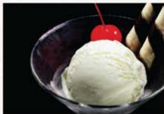
Vanilla Ice Cream バニラアイスクリーム 55