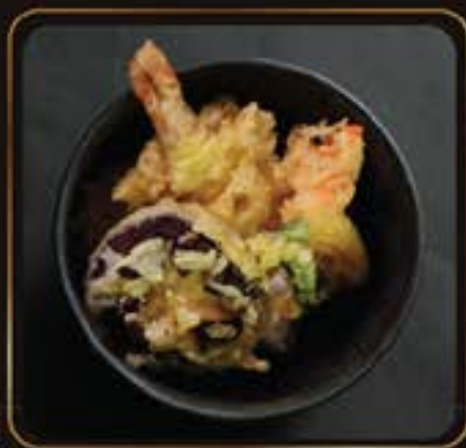
Mini Ten Don