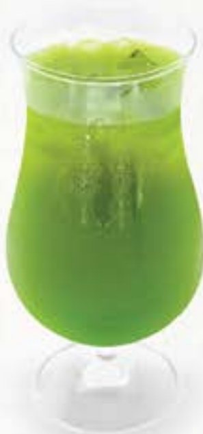
マンゴー抹茶 グリーンティー Matcha Green Tea