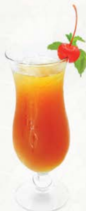
レイシティー Lychee Tea