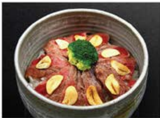
和牛丼 Wagyu Don beef with egg served on top of rice bowl 530