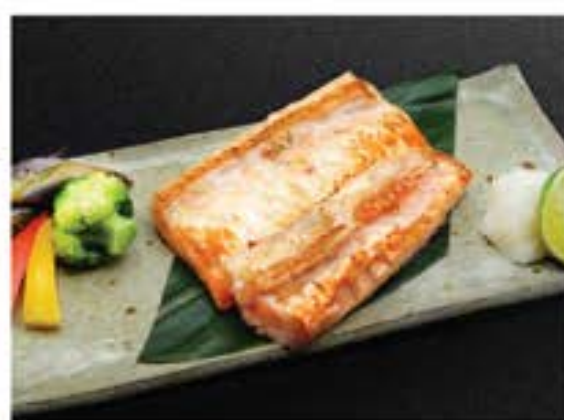
サーモンハラス炭火焼き Salmon Harashu Yaki