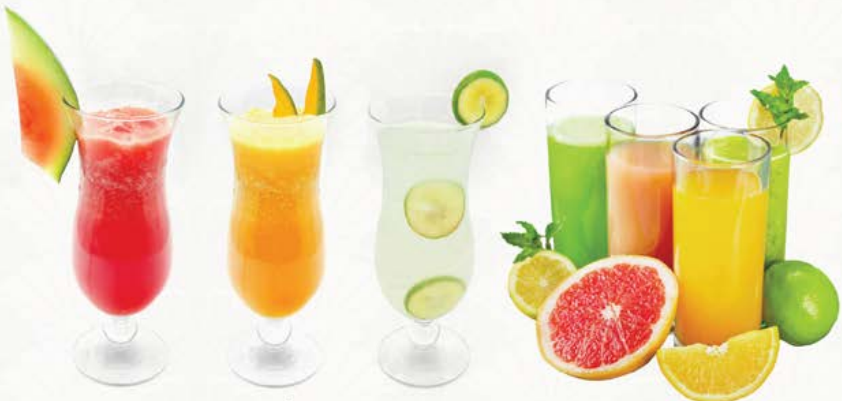
スイカ Watermelon Juice 65