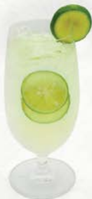
Lime Squash ライムスカッシュ 65