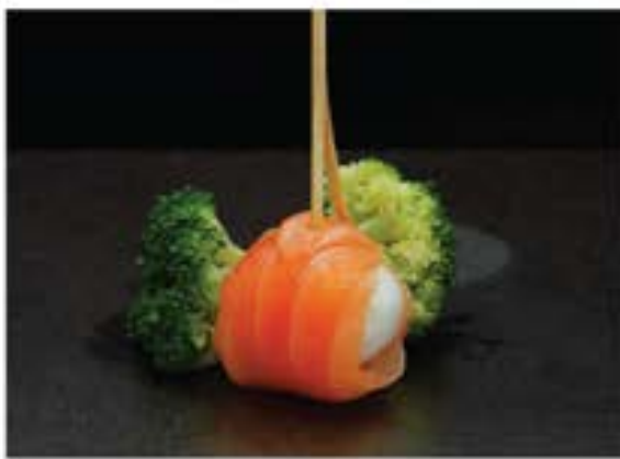
• Salmon Uzura Tamago 35 • サーモン鶺玉子