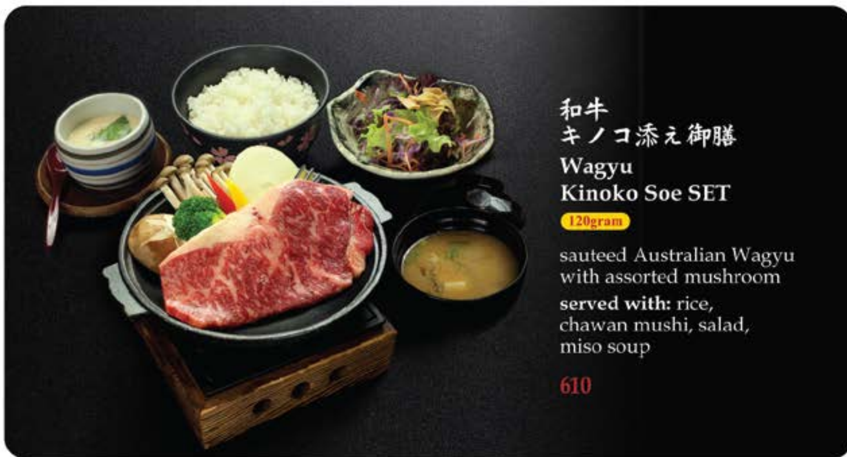
和牛 キノコ添え御膳 Wagyu Kinoko Soe SET