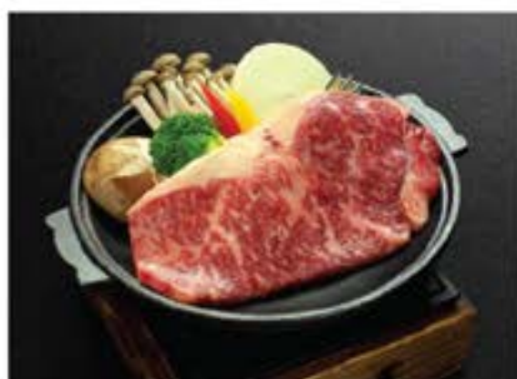
オーストラリア和牛 キノコ添え