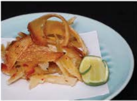
エイヒレ Eihire 195 dried stingray fin