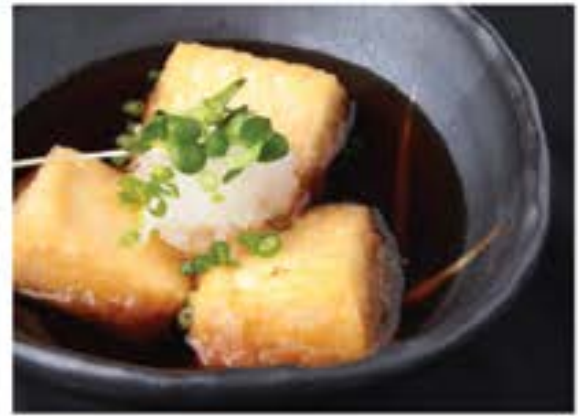
揚げ出し豆腐 Agedashi Tofu (4 pcs) 85 deep fried tofu in a soup