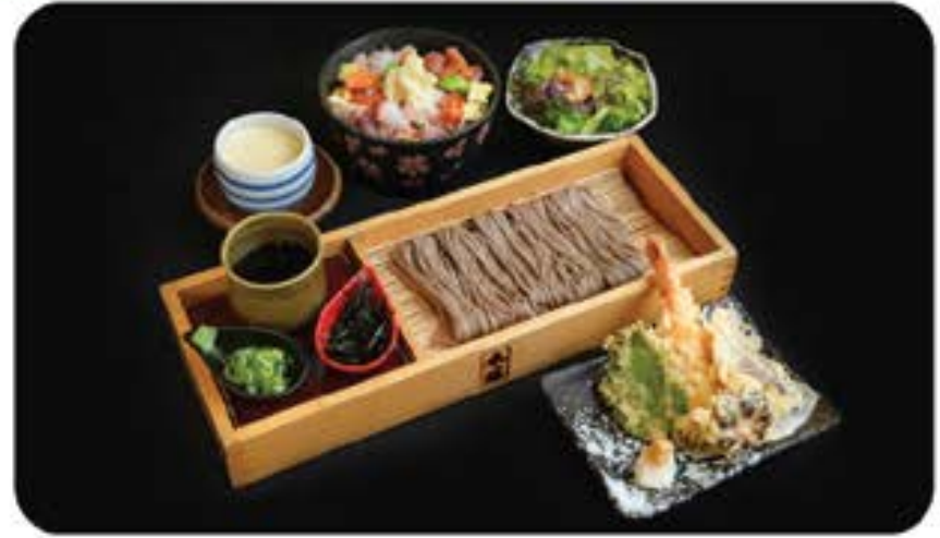
つけ天そばうどん Tsuketen Soba / Udon

(cold) tempura soba/udon with dipping soup