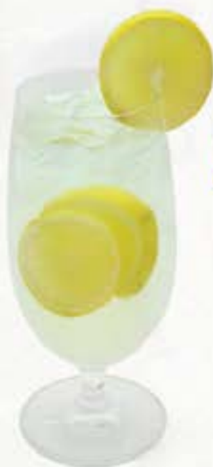
Lemon Squash レモン スカッシュ 65