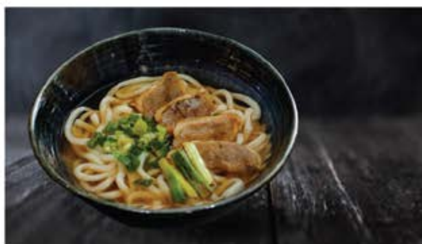
鴨南蛮そばうどん Kamo Nanban Soba / Udon 130 duck soba or udon