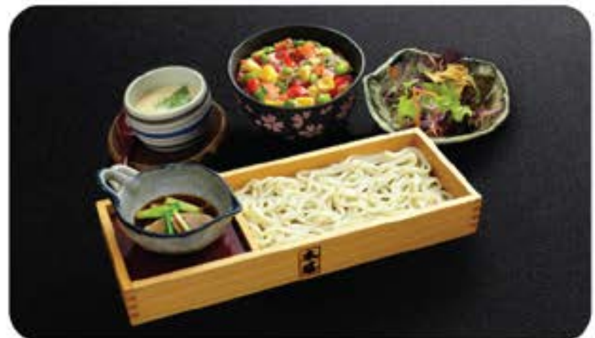
鴨汁そばうどん Kamojiru Soba / Udon