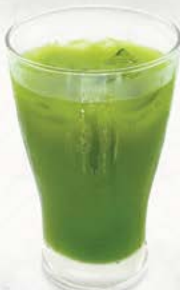
Rich Green Tea High 濃厚緑茶ハイ 130