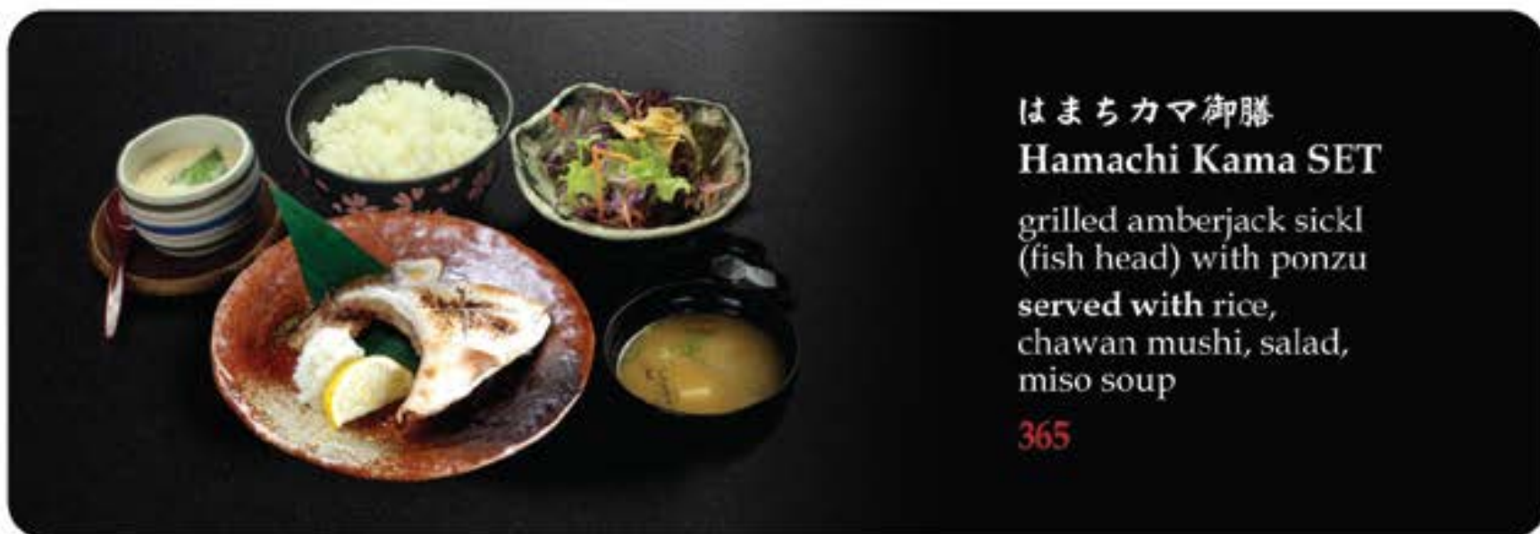
はまちカマ御膳 Hamachi Kama SET

grilled amberjack sickl (fish head) with ponzu served with rice, chawan mushi, salad, miso soup