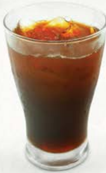
Rich Oolong Tea High 煮だしウーロンハイ 135