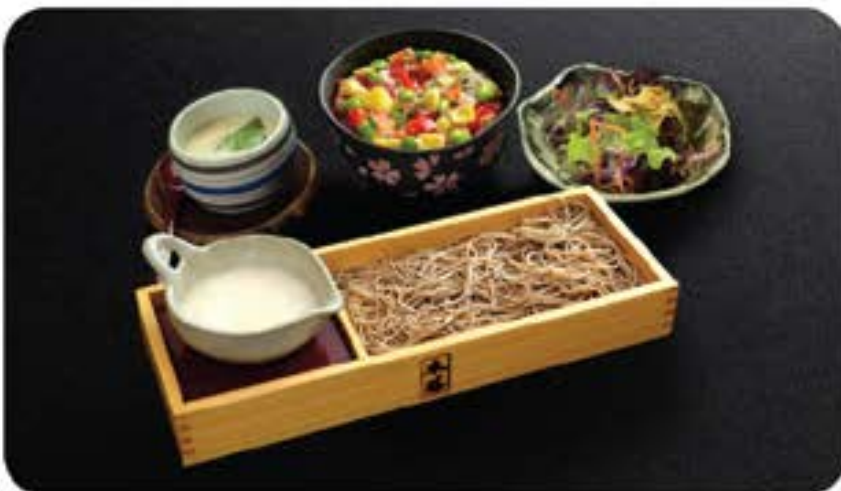
とろろそばうどん Tororo Soba / Udon