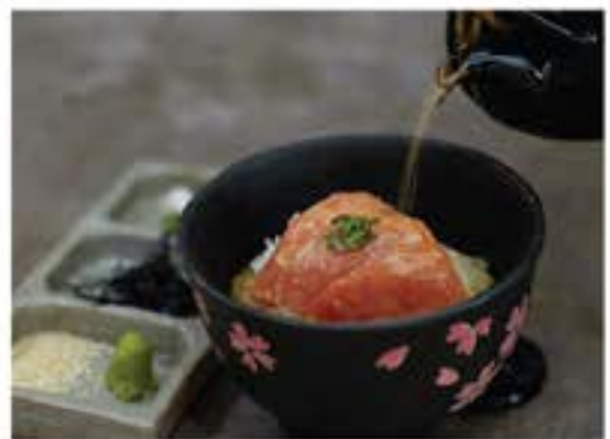
鮪茶漬 Maguro Chazuke tuna and rice with tea broth 105