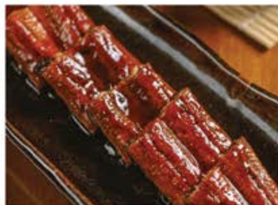
うなぎ蒲焼 Unagi Kabayaki