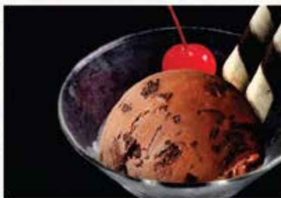
Chocolate Ice Cream チョコレートアイスクリーム 60