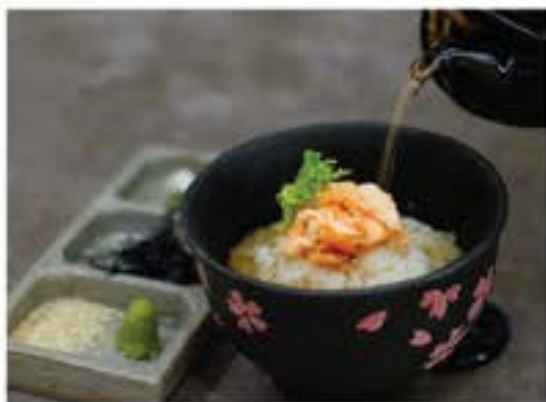
鮭茶漬 Shake Chazuke salmon and rice with tea broth 105