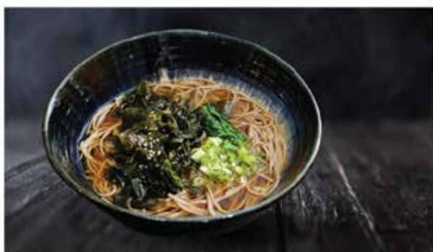
わかめ そば/うどん Wakame soba / udon 105 seaweed soba or udon