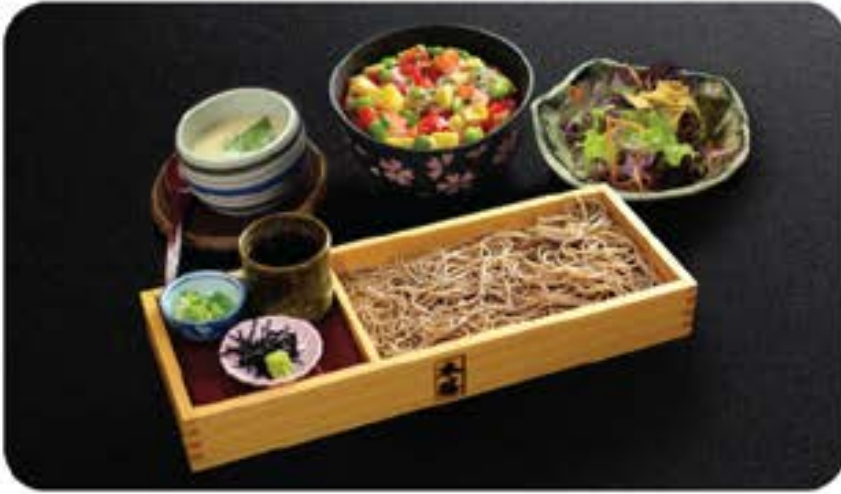
ざるそばうどん Zaru Soba / Udon