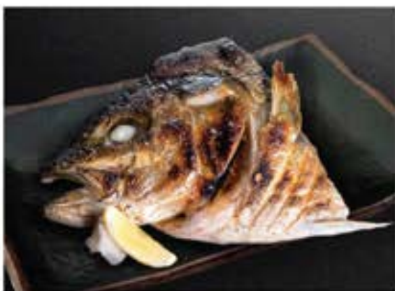
ハマチ・かんぱち兜焼き Hamachi / Kanpachi Kabuto Yaki

grilled amberjack head with sweet soy sauce