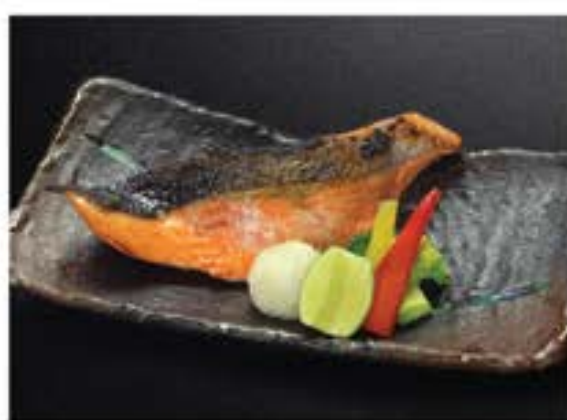
サーモン焼き <塩・照り焼き> Salmon Yaki

grilled salmon with salt /teriyaki sauce