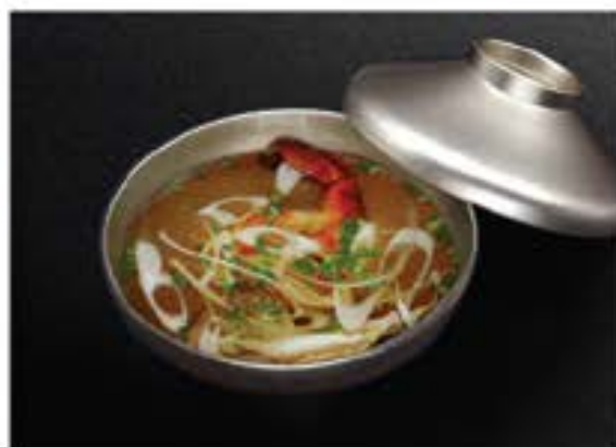
吸い物 Suimono 50 Japanese clear soup