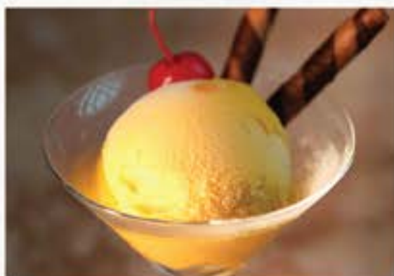
Mango Sorbet マンゴーソルベ 60